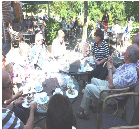
Abb.: Besuch im Landcafe auch das muss sein